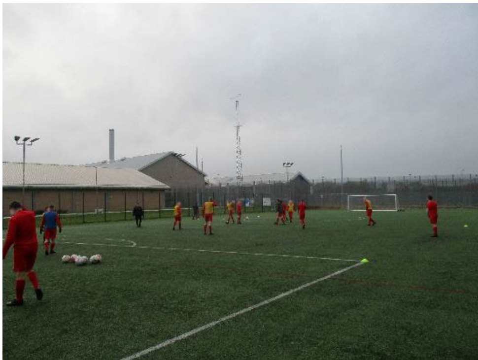
Ystafell bwysau (chwith uchaf), cyfleuster chwaraeon dan do (dde uchaf) a chwaraeon tîm