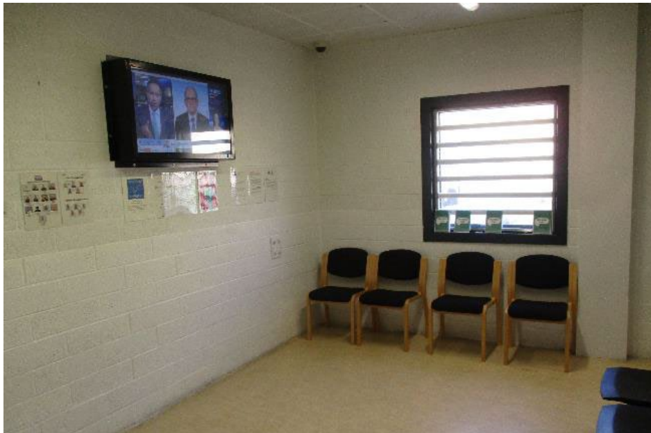
Ystafell gadw yn y dderbynfa