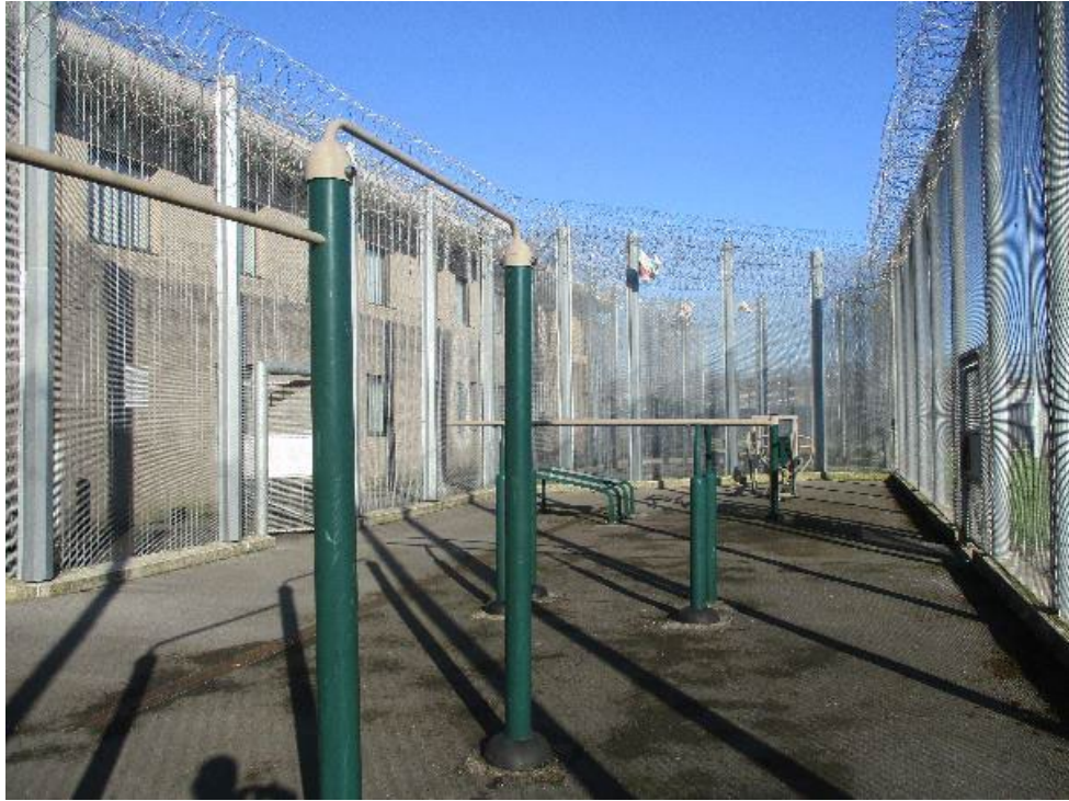
Iard ymarfer corff yr uned wahanu