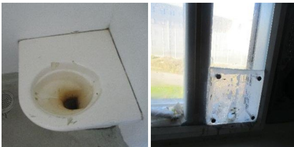
Toiled yr uned wahanu (chwith) a ffenestr wedi'i thrwsio yn yr uned wahanu